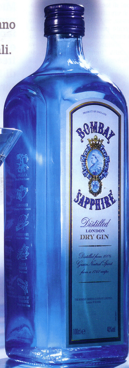
Progetto vincitore della Bombay Sapphire Designer Glass Competition

Sempre più le aziende sposano il design. E lo fanno attraverso nuove modalità che vanno ben oltre le dinamiche produttive e commerciali. Bensì promuovendo la cultura, l'arte ed i giovani talenti.