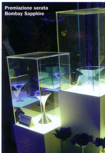
Premiazione serata Bombay Sapphire