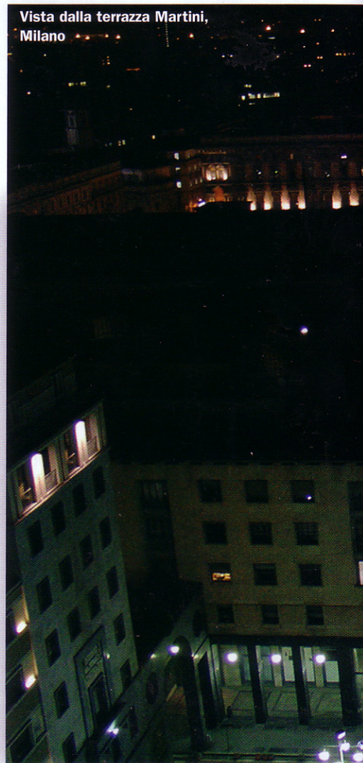
Vista dalla terrazza Martini, Milano

MINI - autentica icona del car design - sosterrà il Museo del Design voluto dalla Fondazione Triennale di Milano. In particolare contribuirà alla selezione delle idee creative per gli allestimenti dei pros-