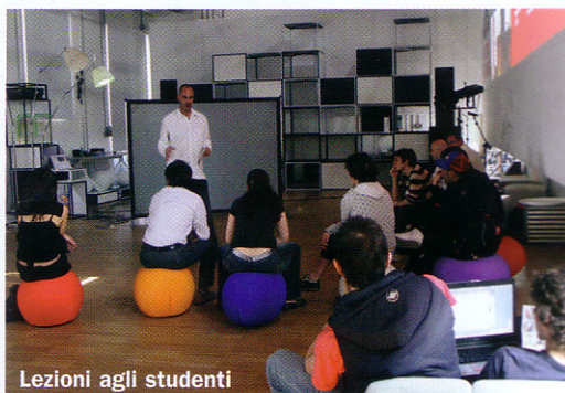
Lezioni agli studenti