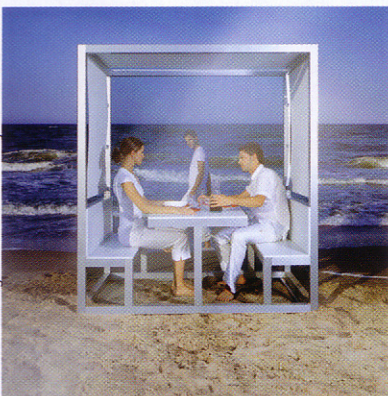
Wall champions - design R.Rodriguez Sevillano for KS Barcelona